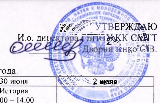
График проведения экзаменов для групп второго курса 2019 – 2020 учебного года.